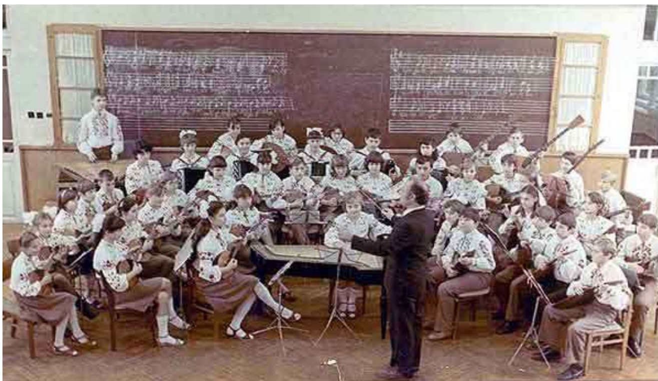
Підчас репетиції оркестру

З цього моменту його життя нерозривно пов'язане з оркестром, який сьогодні відомий як Народний художній колектив Оркестр народних інструментів.