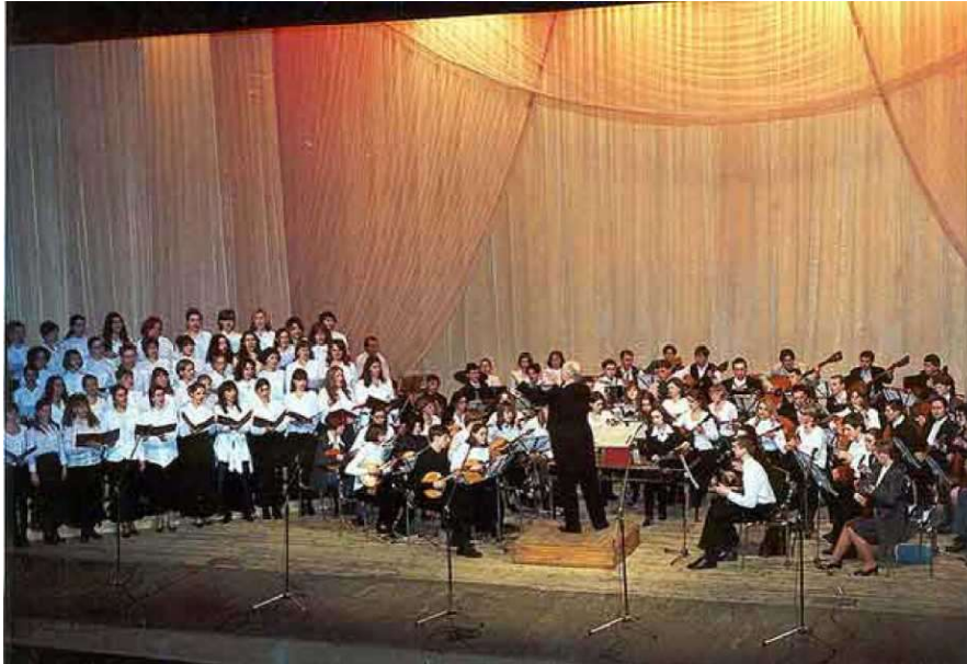
Оркестр музичного училища

училища та молодіжного народно-інструментального ансамблю «Надія», який було створено за ініціативи випускників дитячого Оркестру.