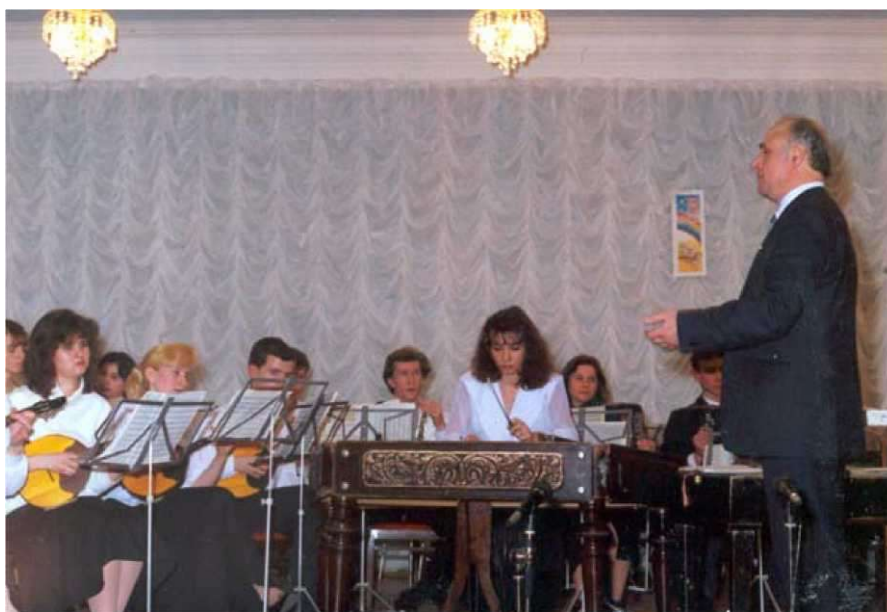
Ансамбль народної музики “Надія”